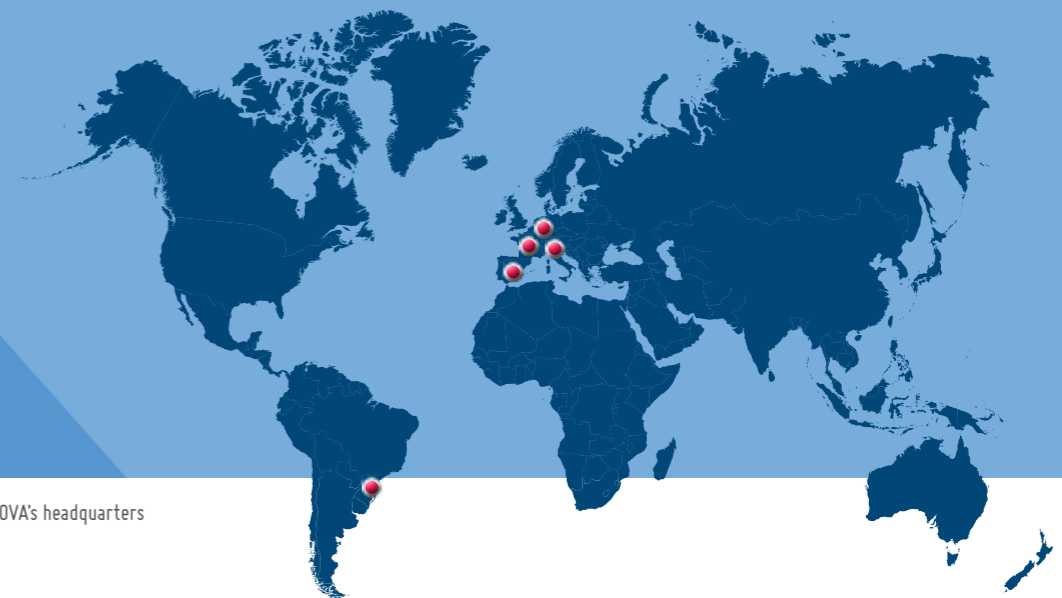
● TAMA AERNOVA's headquarters

ITALIA, FRANCIA, SPAGNA, BRASILE, GERMANIA: CINQUE SEDI PER UN UNICO PARTNER GLOBALE ITALY, FRANCE, SPAIN, BRAZIL, GERMANY: FIVE HEADQUARTERS FOR ONE GLOBAL PARTNER